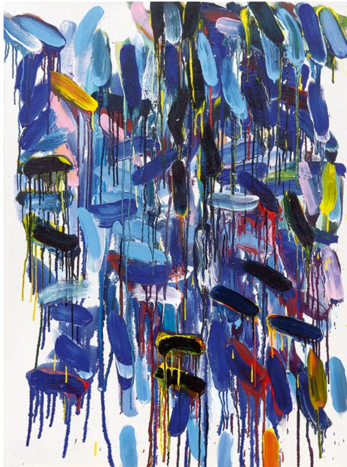
oben: Ursula Jüngst, Lonesome, 2024, Öl / Lw, 120 x 90 cm rechts: Ursula Jüngst, Dies irae - dies illa, 2023, Öl / Lw, 150 x 150 cm

Im Geschichteten und im gegenseitigen Durchdringen der farbigen Pinselsetzungen und Fließspuren entstehen freischwingende Farbklangräume. Ihre Malerei ist mutig und ermutigend. Ihre verdichteten Empfindungswelten ziehen den Betrachter in den Bann.